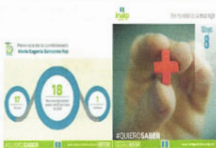
Imagen para el Taller para periodistas sobre uso de la PNT, con motivo del Día internacional de la libertad de prensa (back, invitación y reconocimientos).